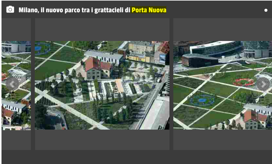
Milano, il nuovo parco tra i grattacieli di Porta Nuova

che valorizzeranno il patrimonio naturalistico. Novantamila metri quadrati di giardino botanico con 90 mila piante e 450 alberi, aree attrezzate per lo sport, foreste circolari tematiche, orti, percorsi didattici, sentieri per bici e runner: eccolo, l'ultimo tassello della riqualificazione dello scalo ex Varesine. Era il 2004, quando il Comune lanciò per la prima volta il bando per realizzarlo.